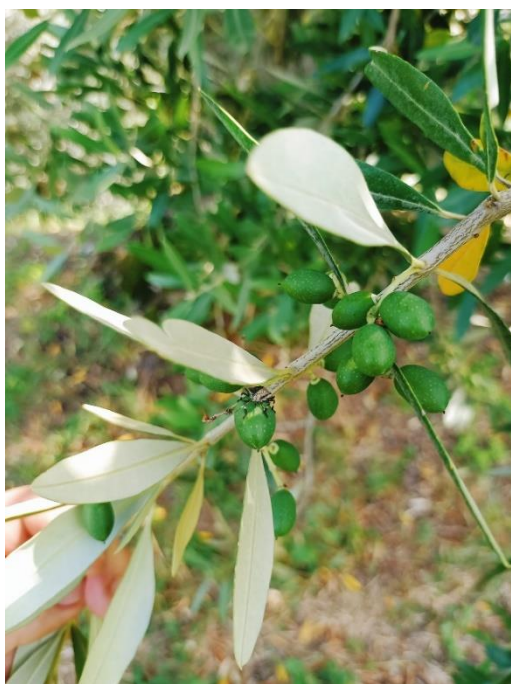
Fig 3_cimice asiatica su drupe (areale gardesano-Valtensesi)

Si raccomanda di effettuare con regolarità, gli sfalci degli oliveti con inerbimento permanente, in modo da controllare agevolmente le infestanti. I costanti temporali e le alte temperature stanno creando un microclima favorevole alle malattie fungine e lo sfalcio costante del cotico erboso in uliveto costituisce un mezzo agronomico volto al contenimento dei patogeni fungini.