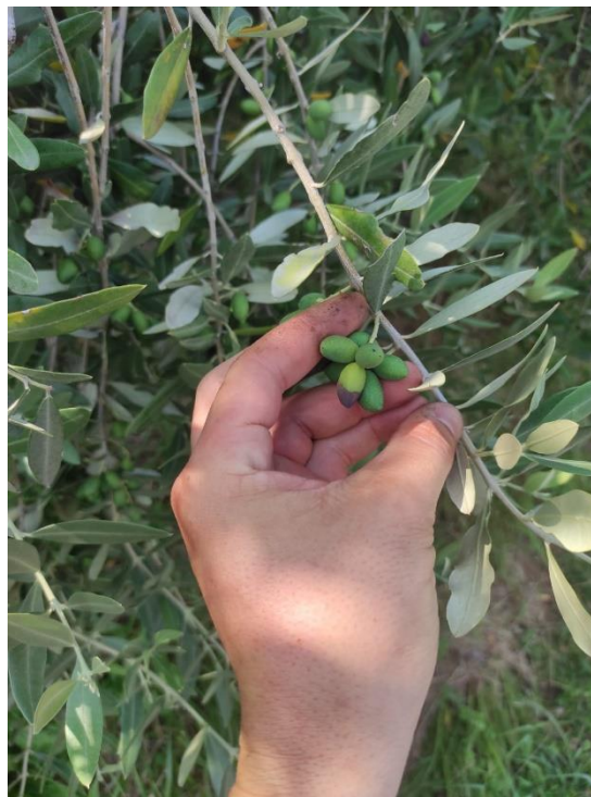
Fig.4 Sintomi di cascola patologica (areale del Sebino)

N.B. IL SERVIZIO FITOSANITARIO REGIONALE HA ESPRESSO PARERE POSITIVO ALL'IMPIEGO DELLA SOSTANZA ATTIVA DELTAMETRINA IN DIFESA DAGLI ATTACCHI DI HALYMORPHA HALYS SU OLIVO