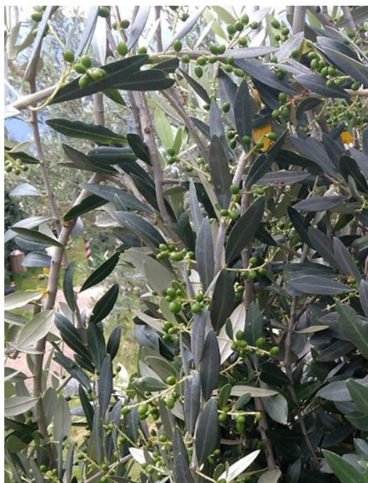
Fig 1- post allegazione_accrescimento del frutto

PAROLE CHIAVE: ACCRESCIMENTO FRUTTO, CASCOLA PATOLOGICA, CIMICE ASIATICA, MOSCA DELL'OLIVO, SFALCIO, DEROGA